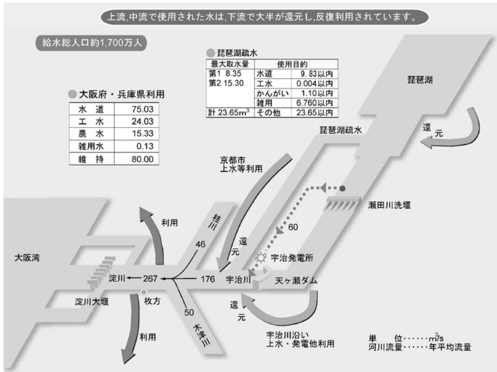
【図 1-13 淀川水系の水利用】